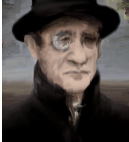
Fig. 8 Épisode 2, 7 : 40

Mais à la dimension fantasque s'est ajoutée une image d'échec : Max Jacob est celui qui ne réussit pas. Les réalisatrices ont recours à des images filmiques, intercalées aux images d'animation, afin de construire une illustration de la tristesse du poète : on nous montre en effet des images d'un homme marchant, faisant suite à la marche de ce personnage animé figurant Max Jacob, comme si on voulait nous faire croire que des images statiques ont trouvé leur incarnation et que nous voyons subitement Jacob bouger à l'écran, sur les bords de l'eau, désœuvré, toujours de dos. Ces images fonctionnent par association et collent au personnage qu'on a souhaité construire. L'illustration se poursuit, lorsqu'on nous montre le visage de Jacob en mouvement, comme si les mouvements de l'eau animaient une toile. Tristesse et solitude deviendront les nouvelles marques du poète, qui assiste à la création d'un monde dont il est exclu et qui ne possède plus la fraîche fantaisie des premiers temps. Ainsi sont illustrés le passage du temps, la disparition du Bateau Lavoir et de la camaraderie, la dissolution des amitiés et d'une époque plus glorieuse, mais définitivement plus sombre (Fig. 9).