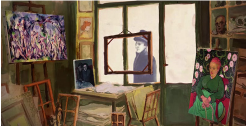
Fig. 4 Épisode 1, 3 : 01

Au début de cet épisode, des images de Paris, de la vie au pied de Montmartre, ainsi que des images animées rappelant la vie festive dans ce coin de la ville (Aristide Bruant qu'on reconnaît à son écharpe rouge, La Goulue et ses jupons) sont intercalées entre les passages d'animation concernant Jacob. On retrouve ensuite le poète à la fenêtre de la galerie du marchand Ambroise Vollard. Cette image de Jacob à la fenêtre (Fig. 4) illustre l'attitude qu'on veut lui prêter à l'écran : il est présent tout au long du récit, il y participe, mais en marge, à l'extérieur, il observe, il assiste, il regarde.