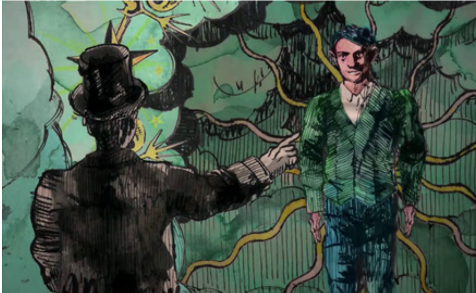
Fig. 7 Épisode 1, 6 : 12

Quelques minutes sont ensuite consacrées à Jacob poète : une animation qui devient très colorée le montre flamboyant, récitant des extraits de son premier conte publié en 1913, Le roi Kaboul 1 er et le marmiton Gaumain . Mais ce moment est de courte durée : Max Jacob n'apparaîtra plus à l'écran que comme un témoin du succès des artistes l'entourant. Au cours de cette scène de récitation, Picasso lui dit : « Tu es le plus grand poète français », et Jacob lui répond : « Toi, le plus grand peintre espagnol » (Fig 7).