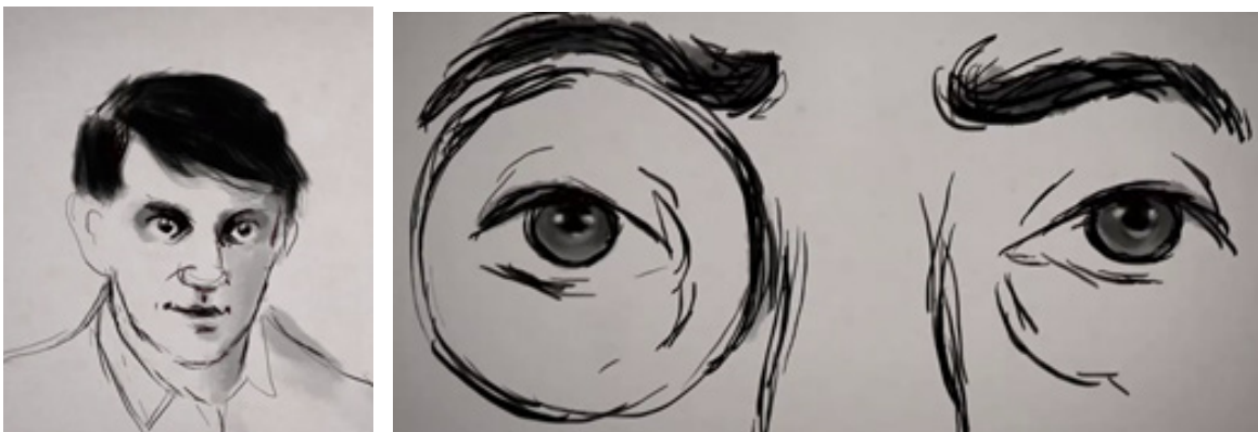
Fig. 5 Épisode 1, 4 : 27

La première découverte picturale qu'il fait chez Vollard est celle de Picasso, l'œuvre avant l'homme. Une heure plus tard , on nous le montre sonnant à la porte du peintre. La véritable rencontre entre les deux personnages se fait par les yeux : on insiste, dans le choix des images filmiques et dans le dessin de l'animation, sur ces regards (Fig. 5 et 6). Quelque chose de l'ordre du symbole se dessine, illustrant une complicité que l'on montre instantanée et qui constituera le socle sur lequel s'est construit l'amitié entre les deux hommes.