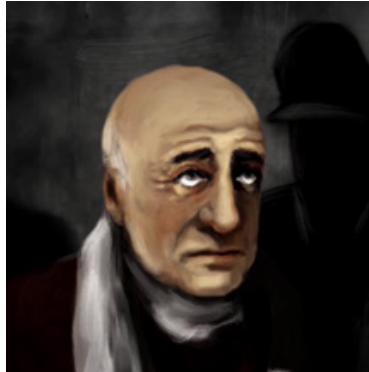
Fig. 10 Épisode 6, 45:13

par le personnage de Max Jacob alors qu'il est embarqué par la Gestapo : « Prévenez Picasso, à Paris », le peintre étant ainsi présenté comme le dernier recours lors l'arrestation du poète. On voit ensuite des images des épisodes antérieurs – Picasso et Jacob dansant, Max Jacob passant devant la boutique de Vollard, on voit aussi des images des fantasmagories de Jacob auxquelles il accède grâce aux drogues, à l'éther, bref, on assiste au retour sur une époque disparue où il était heureux. Ces animations sont lumineuses, colorées, ce qui contraste avec les animations du présent de Jacob, noires et sombres, dans lesquelles il apparaît vieux, chauve, ayant délaissé ses attributs farfelus – monocle, haut-de-forme, cape –, et où il est entouré de personnages qui ne sont représentés que par des ombres (Fig. 10).