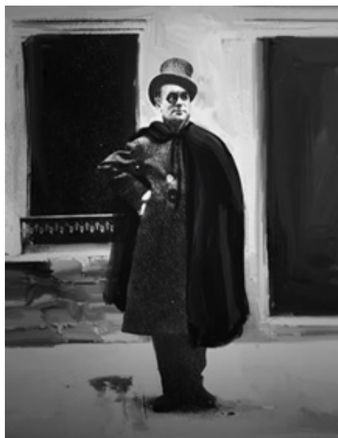
Fig. 3 Épisode 1, 21 : 23

Le choix de ces accessoires distinctifs permet alors de construire un personnage conforme à la représentation que le spectateur se fait du poète et en adéquation avec les témoignages de certains de ses contemporains. Ainsi, l'image retenue de Jacob par les réalisatrices recoupe un portrait qu'Apollinaire en fait en 1910 :