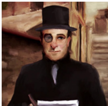
Fig. 1 Épisode 1, 1 : 46